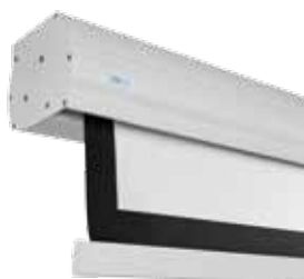
WYPOSAŻENIE PODSTAWOWE: PRZEŁĄCZNIK